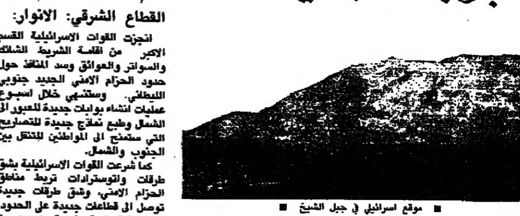
موقع اسرائيلي في جبل الشيخ